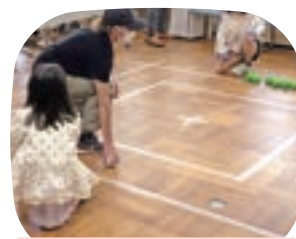
〈NPO法人クレヨン・リンク〉 ボッチャ体験