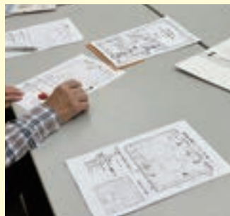
家の中の家具の安全確保する対処方法を学びました。 「KAG(家具安全対策ゲーム)」