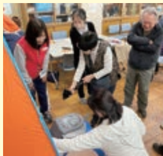
非常用携帯トイレを体験