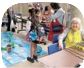
〈精神保健福祉ボランティアポコポコ〉 おもちゃ、魚つり