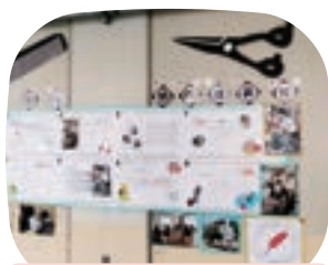
〈社会福祉協議会〉 福祉訪問理美容展示