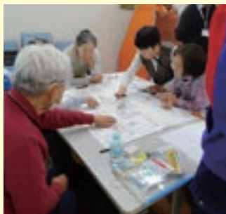
避難所を疑似体験 「ひなんしょうたいけんカードゲーム」