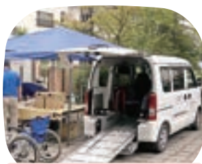
〈移送サービスボランティアすまいる〉 福祉車両展示