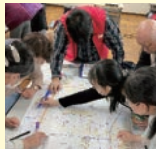
地図を使い災害を想定し危険箇所など書き込みました。 「DIG(災害図上訓練)」