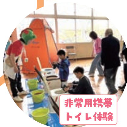
非常用携帯 トイレ体験