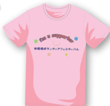
おそろいのTシャツでサポート していただきました♡