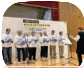
初出演! 〈GOGOボイス〉 男性コーラス