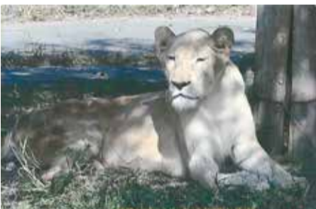
セントラルパークのライオン

風なレストランでおいしい料理の品々を沢山配膳してあり、ビール銘酒付きで酔い潰れないうちにチビリチビリと頂きました。 食事が終わって外に出ると、すぐ隣に銘酒の展示と即売品が陳列してあり、一周見て回りお酒の好きな自分は原酒の中瓶を買いました。 予定より少し早くバスに乗り、土産物屋の「夢鮮館」に立寄り、土産物と云ってもここではお菓子等ではなくチクワ・カマボコの種類の多い品々を陳列販売していました。一周見て回り、ハモチクワを一箱買いました。 ここからバスは来た高速道に入り帰路につき、ガイドさんの話やクイズがあり賞品も出ました。最後に最高齢者の方はどなたですか