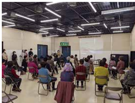
講習を受けているところ