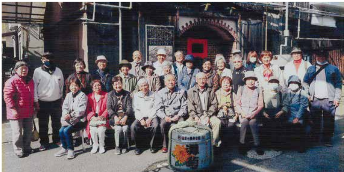
田原台・長寿会の皆さん

と問われると、隣席の何人もの人が自分を指差してくれて、立派な賞品を頂きました。90才半ばです。 最後は、ビンゴゲームで皆に何か当り、方々からビンゴと手をあげる人が次々と続いて楽しい一時を過ごしました。 予定の時間通りに田原台に帰着。 この旅行を計画された会長さん役員さんと皆さん、ありがとうございました。