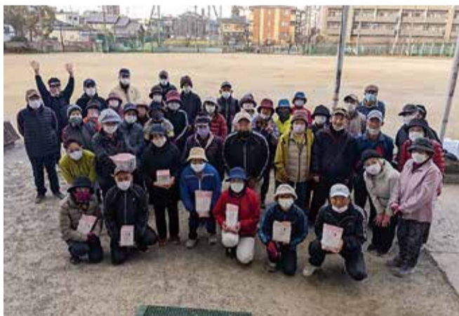
練習に参加した皆さん

全国老人クラブ連合会より、「2021 活動賞」をいただきました!! 2020(令和2)年のコロナ禍の真只中に開催した、「こんなんできちゃいました! 展示会!」が評価され、受賞いたしました。開催するにあたり、出品された方々、準備をされた役員の方々、みなさんのご尽力の賜物です! 本当におめでとうございます!