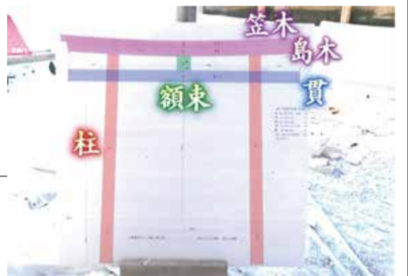
鳥居のパーツ名入りの図面

のパーツ作りが始まっていた。手斧という道具で切り込みに合わせて削り込んでいく。「なかなかこれがえらい作業で、腕がパンパンになります」と少し弱気が出ていた。一般の住宅と違って曲線が必要になりすべて手作業との事。