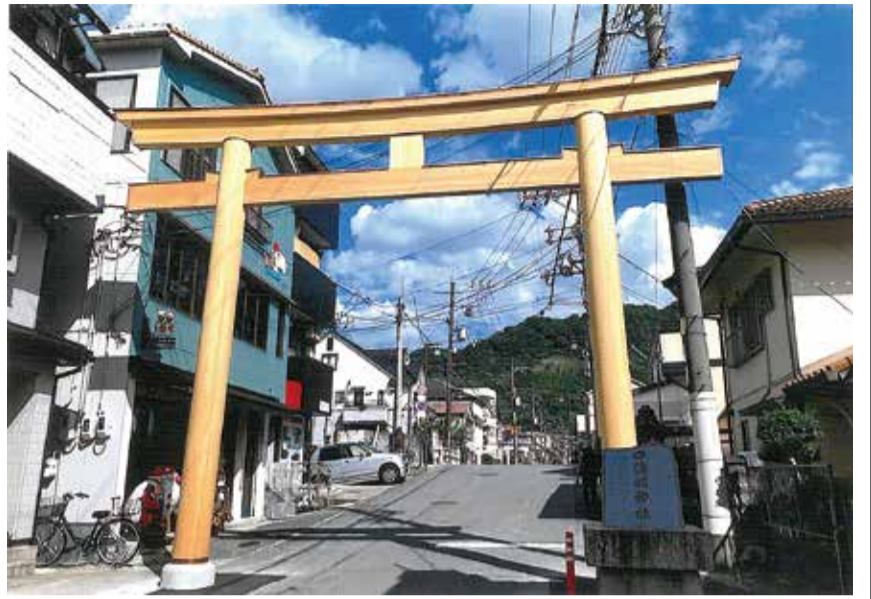
再建された大鳥居