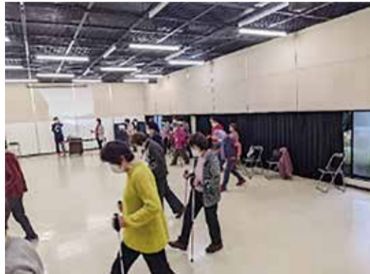
体験用ポールを使用しての歩き